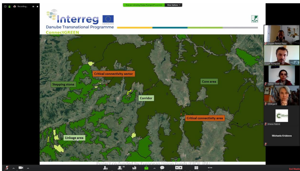
Obrázek 1: Prezentace o identifikaci ekologických koridorů během online setkání.

Aktualizace Metodiky pro identifikaci ekologických koridorů ukázala, jak se formuje a přizpůsobuje novým požadavkům díky provedenému testování v terénu a hodnocení kvality. Také Mapa ekologických koridorů v Karpatech se posunula o významný krok vpřed díky modelování i práci v terénu. V současné době odborníci pracují na kritických zónách ekologických koridorů a územního plánování v pilotních oblastech, které budou základem akčních plánů. Práce mimo jiné zahrnuje sběr údajů o výskytu populací medvěda, rysa a vlka, soupis překážek, analýzu územních plánů a setkání se zúčastněnými stranami.